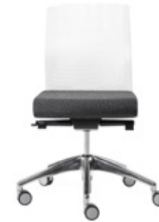
— Chair synchro w/mesh medium backrest Silla sincro con respaldo medio de malla