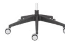
— 5 star Polyamide 5 radios poliamida + casters / ruedas