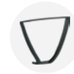
— Fix arm Brazo fijo