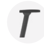
— 4D adjustable arm in polyamide Brazo regulable 4D de poliamida