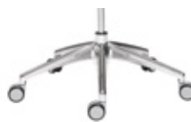
— 5 star polished aluminium 5 radios aluminio pulido + casters / ruedas