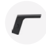
— Standard adjustable arm Brazo regulable estándar