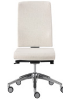
— Chair synchro upholstered high backrest Silla sincro con respaldo alto tapizado