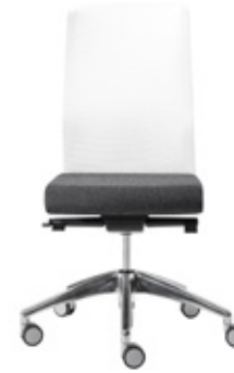
— Chair synchro w/mesh high backrest Silla sincro con respaldo alto de malla