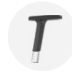
— 4D adjustable arm polished aluminum Brazo regulable 4D aluminio pulido