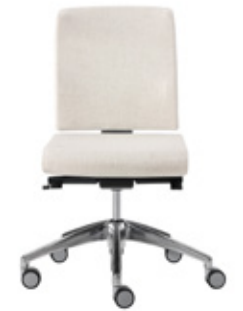
— Chair synchro upholstered medium backrest Silla sincro con respaldo medio tapizado