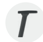
— 4D adjustable arms Brazo regulable 4D