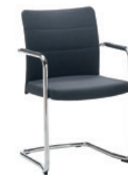
— Visitor chair w/ cantilever base upholstered backrest Silla con pie patín respaldo tapizado