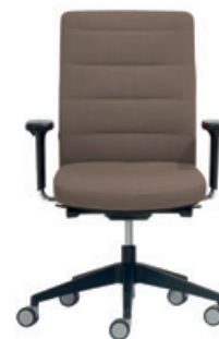
— Task chair syncro w/upholstered backrest Silla sincro respaldo tapizado