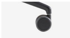
Soft tread Rueda blanda