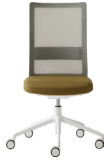
Task chair Silla de trabajo