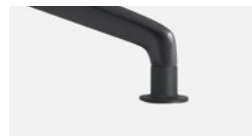
Fixed glides Topes fijos