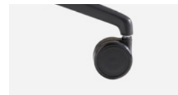
Hard tread Rueda dura