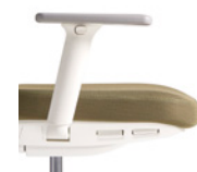
4D adjustable arms. Available in white or black. Brazos ajustables 4D. Disponible en blanco o negro.