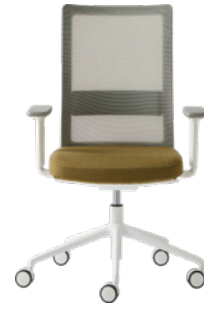
Task chair with armrests Silla de trabajo con brazos