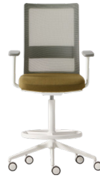
Stool with armrests Taburete con brazos

MOVEMENT OPTIONS / OPCIONES DE MOVIMIENTO Gas lift / Elevación a gas Gas lift + Synchro / Elevación a gas + Sincro