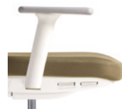
Fix arms with width adjustment. Available in white or black. Brazos fijos con ajuste de anchura. Disponible en blanco o negro.