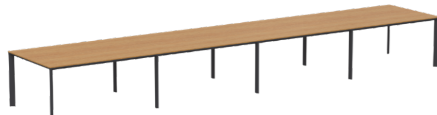
TABLE TOPS MATERIALS