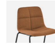
– Quilted upholstery Tapizado quilted