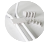
– Linking clips Clips de unión