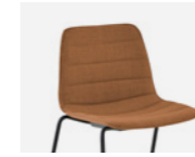
– Horizontal stitching Costuras horizontales