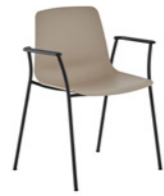
– 4 leg armchair stackable Sillón 4 patas apilable