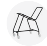
– Trolley Carro