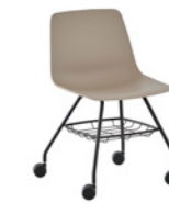
– 4 leg frame + casters + basket Pie 4 patas + ruedas + cesto