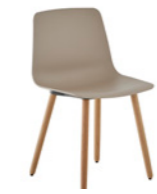
– 4 wooden leg frame Pie 4 patas de madera