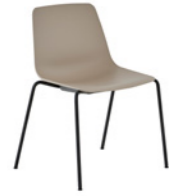
– 4 leg frame Pie 4 patas