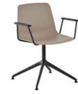
– Aluminum swivel base + arms Base giratoria de aluminio + brazos