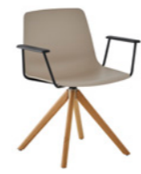
– Wooden swivel base + arms Base madera giratoria + brazos