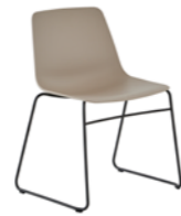
– Sled base Pie de varilla