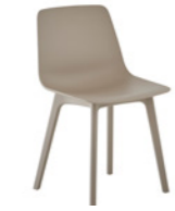
– 4 plastic leg frame Pie 4 patas de plástico