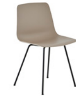
– 4 leg frame non stackable Pie 4 patas no apilable