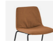
– Soft upholstery Tapicería soft