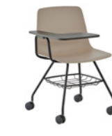
– 4 leg frame + casters + basket + writing tablet Pie 4 patas + ruedas + cesto + pala escritura