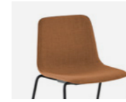
– Plain upholstery Tapicería lisa