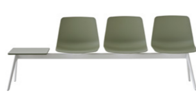
– Bench 2-5 seater Banco 2-5 plazas