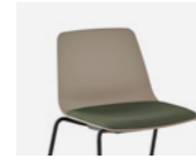
– Fix upholstered pad Panel de asiento fijo