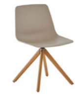
– Wooden swivel base Base madera giratoria