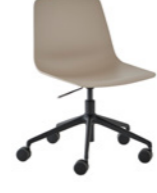
– Aluminum swivel base + casters + gas lift Base giratoria de aluminio + ruedas + gas