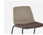
– Removable upholstered pad Almohada de asiento desenfundable