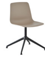
– Aluminum swivel base Base giratoria de aluminio