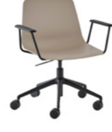
– Aluminum swivel base + casters + gas lift + arms Base giratoria de aluminio + ruedas + gas + brazos