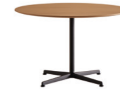
H.175cm table base Base A.75cm para mesa