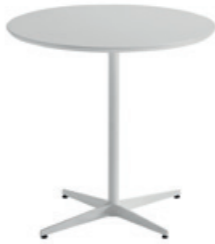
Base for table H.73cm Base para mesa A.73cm

60x60cm 70x70cm 80x80cm Ø60cm Ø70cm Ø80cm