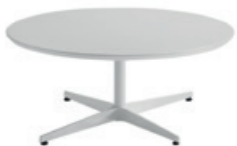
Base for table H.38cm Base para mesa A.38cm

60x60cm 70x70cm 80x80cm Ø60 cm Ø70 cm Ø80 cm