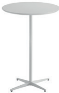
Base for table H.103cm Base para mesa A.103cm

60x60cm 70x70cm 80x80cm Ø60cm Ø70cm Ø80cm