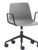
Aluminum swivel base Base giratoria de aluminio + arms / brazos + casters / ruedas + gas lift / gas