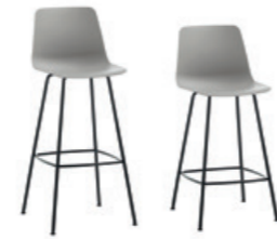
4 leg frame chair Silla con pie 4 patas high - counter / alta - media