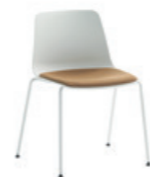
Fixed seat panel Asiento tapizado fijo