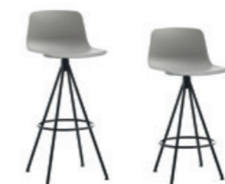
Swivel base stool Taburete base giratoria high - medium / alto - medio