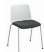
Removable upholstered seat cushion Cojín de asiento desenfundable