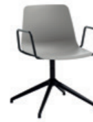
Aluminum swivel base Base giratoria de aluminio + arms / brazos