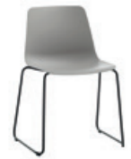
Sled base Pie de varilla