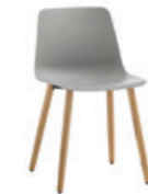
4 wooden leg frame Pie 4 patas de madera