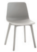
4 plastic leg frame Pie 4 patas de plástico