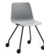
4 leg frame Pie 4 patas + casters / ruedas