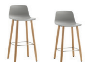
4 wooden leg base stool Taburete 4 patas madera high - medium / alto - medio