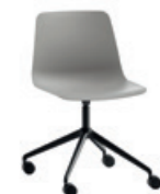
Aluminum swivel base Base giratoria de aluminio + casters / ruedas