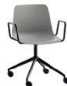
Aluminum swivel base Base giratoria de aluminio + arms / brazos + casters / ruedas