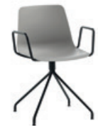
Steel swivel base Base giratoria de acero + arms / brazos