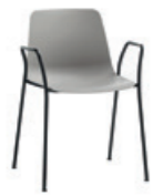
4 leg armchair Sillón 4 patas