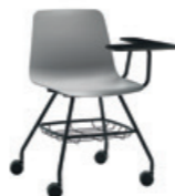
4 leg frame Pie 4 patas + casters / ruedas + writing tablet / pala escritura + basket / cesto