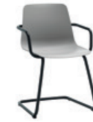
Cantilever base armchair Sillón base patín