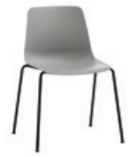
4 leg frame Pie 4 patas