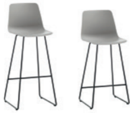
Sled frame chair Silla con base trineo high - counter / alta - media