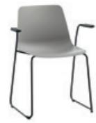
Sled base armchair Sillón pie de varilla