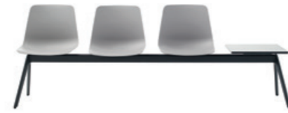
Bench 2-5 seater Banco 2-5 plazas