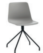
Steel swivel base Base giratoria de acero