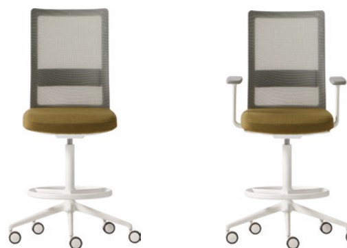
- Stool Taburete

Gas lift + Synchro / Elevación a gas + Sincro