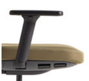
- 4D adjustable arms. Available in white or black. Brazos ajustables 4D. Disponible en blanco o negro.