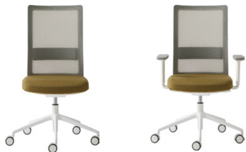
- Task chair Silla de trabajo