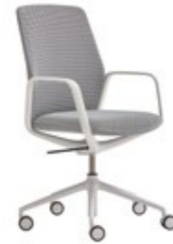
Swivel armchair 5 spoke base on casters