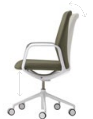
Tilt mechanism. Swivel base on casters. Seat height adjustment with gas lift.