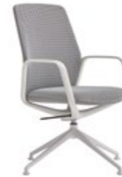
Swivel armchair 4 spoke base